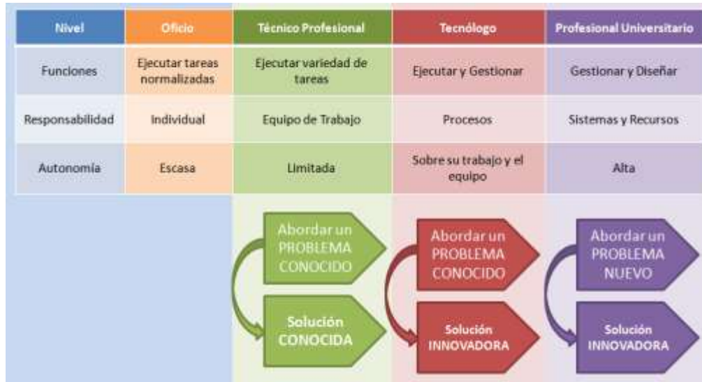
Ilustración 1. Criterios de diferenciación entre los perfiles de egreso de los técnicos laborales, técnicos profesionales y tecnólogos

responsabilidades de concepción, dirección y gestión de conformidad con la especificidad del programa. Este segundo ciclo, junto con el primero, podrá conducir al título de Tecnólogo en el área respectiva”.